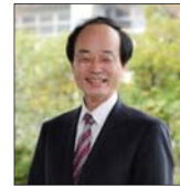
学長 郡 健二郎